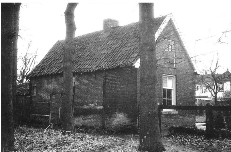
Klopjeshuis bij de Meijershof