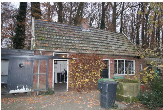
Klopjeshuis in 2014